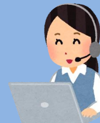
オペレータの自主学習