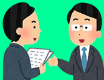
オペレータ評価や教育