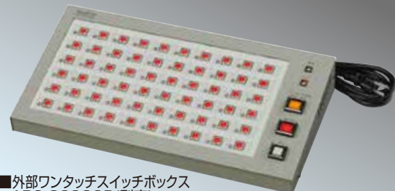
■外部ワンタッチスイッチボックス ARS-8000SB(別売)