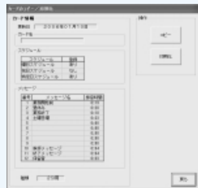
カードのコピー画面例

データ入力ソフト対応OS: Windows 98 / Me / 2000 Professional / XP / Vista 日本語版