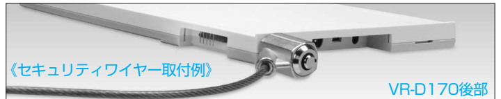
《セキュリティワイヤー取付例》 VR-D170後部 本スロットをご利用の際は、弊社ホームページでスロットの仕様をご確認の上、対応したセキュリティワイヤーなどをお求めください。